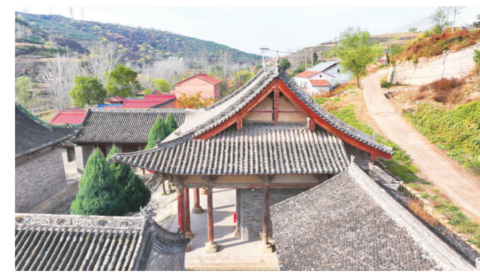
会仙观的三清殿(金)