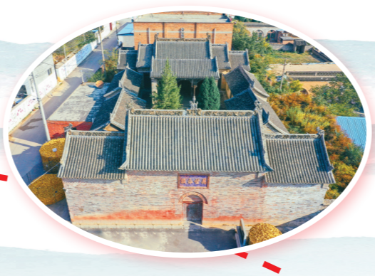
西青北大高庙鸟瞰