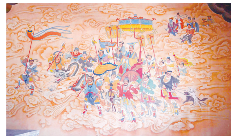
下霍护国灵贶王庙的正殿壁画及浮雕