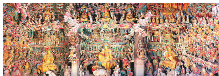
观音堂泥塑像被誉为“海内悬塑之冠”