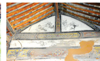
昭泽王庙的大殿山墙壁画彩绘(清)