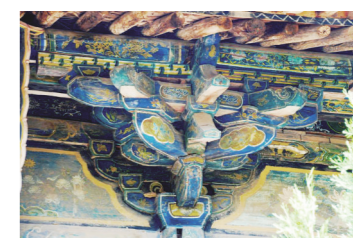
南涅水洪教院的大雄宝殿斗拱