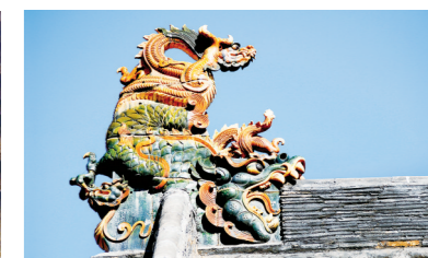
正觉寺的过殿鸱吻