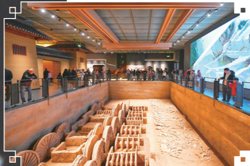
战国车马坑等比例复制