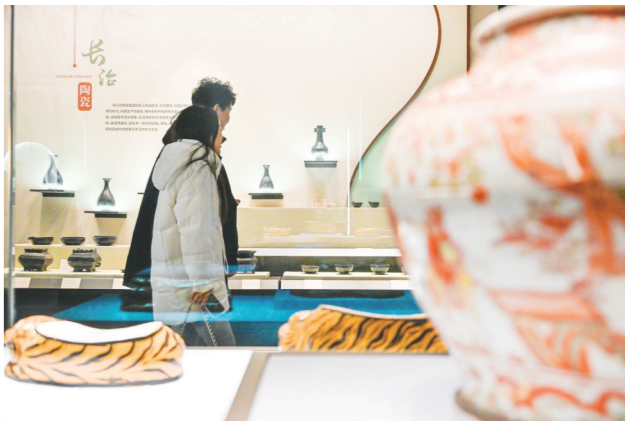
八义窑红绿彩瓷器