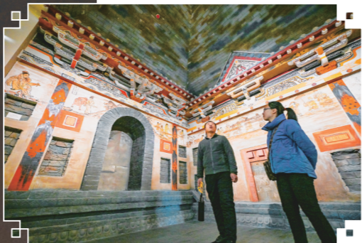
墓葬壁画等比例复制