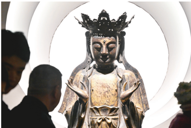
辽代千佛座铜鎏金卢舍那佛坐像