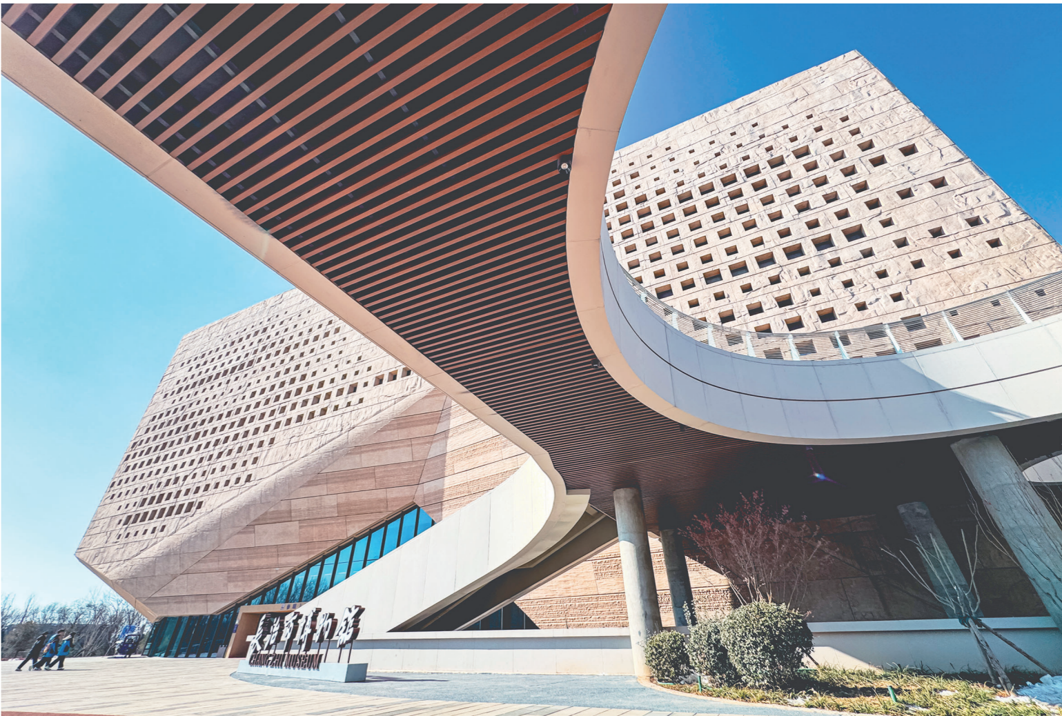
天圆地方,长治新地标

新年伊始,备受瞩目的长治市博物馆新馆正式向公众试运行开放。这座总面积1.7万平方米的“城市文化会客厅”,以崭新姿态迎接八方来客,让市民与游客在文物光影中触摸上党千年文脉,为上党大地再添文化新名片。