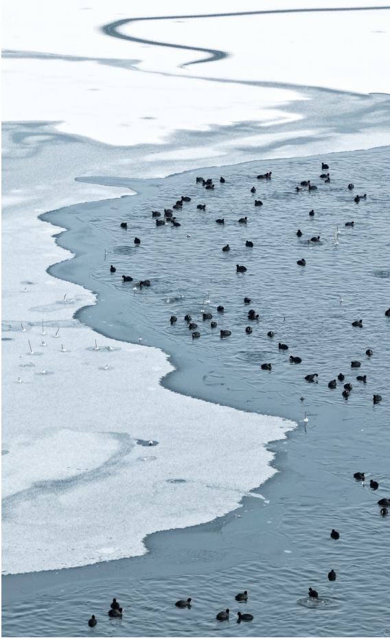
湖面充满了生机与诗意

一场冬雪过后，漳泽湖国家城市湿地公园，冰封湖面如玉镜一般，冰层纹理宛若自然天成的艺术品，“太行天池”以独特的冰雪景致，迎来大天鹅、绿头鸭、灰雁等数万只候鸟翔集，勾勒出“冰雕玉砌，万羽来朝”的生态画卷。