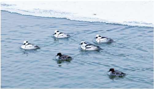
斑头秋沙鸭(熊猫鸭)在湖里游弋