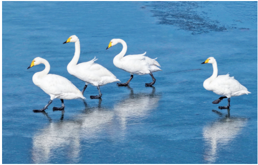
天鹅在冰水间优雅漫步