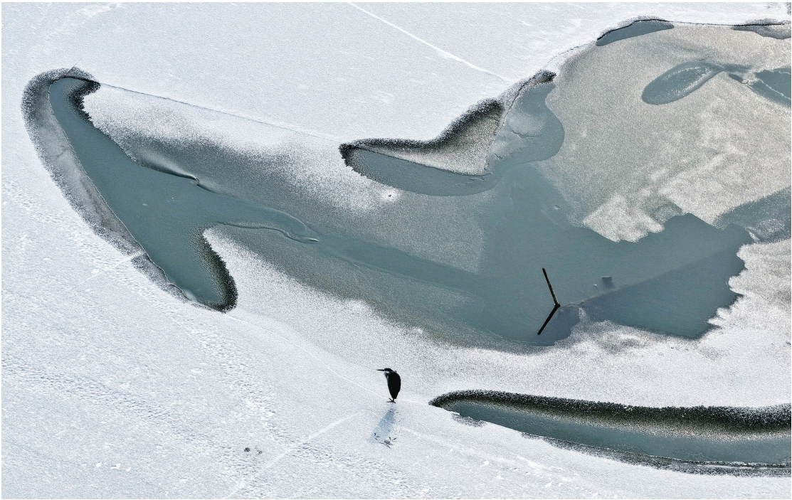
一只水鸟在半冰半水的岸边逗留