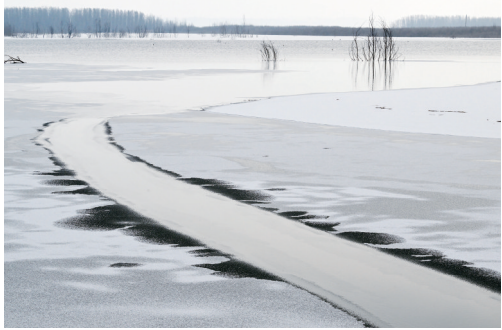
“太行天池”独特的冰雪景观