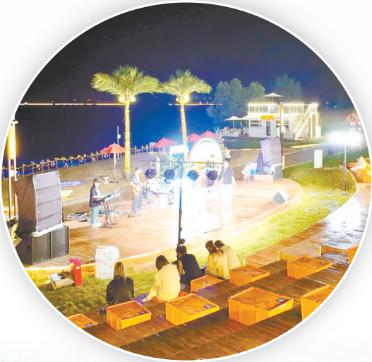
漳泽湖MANA水岸度假区声光迷人

每逢周末，潞州区漳泽湖周边的露营地、骑行道热闹非凡。亲子家庭在此放松身心，尽享天伦之乐；骑行爱好者穿梭其间，尽享运动带来的酣畅淋漓；不远处的湿地公园内，散步、慢跑的市民络绎不绝，共同勾勒出一幅生动鲜活的生态康养画卷。