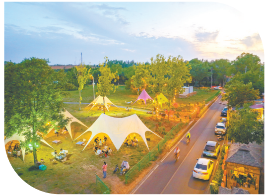
黄碾镇淹村农家乐宾客盈门

从远道而来的“候鸟式”旅居客，到焕发新生的乡村民宿，再到多点开花的非遗体验、夜经济等业态，潞州区以业态创新为抓手，驱动文旅康养产业向高品质、多元化升级，让更多游客走进潞州、爱上潞州，尽情领略这里的生态之美、文化之韵、康养之乐。