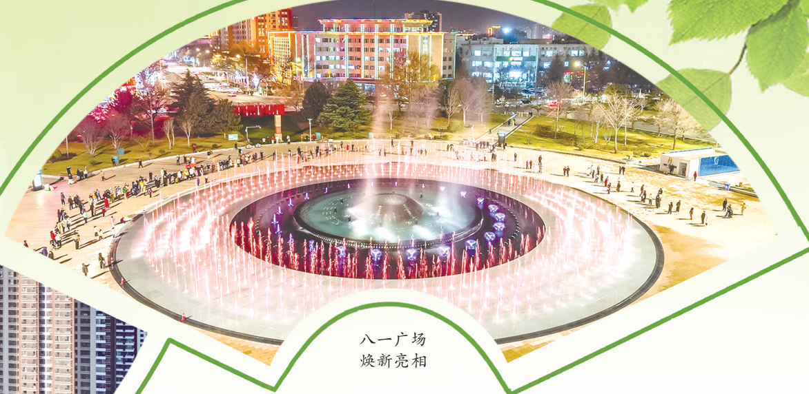
八一广场 焕新亮相