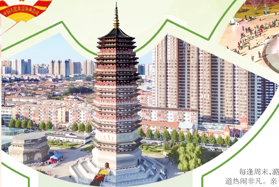
六府塔公园风光如画