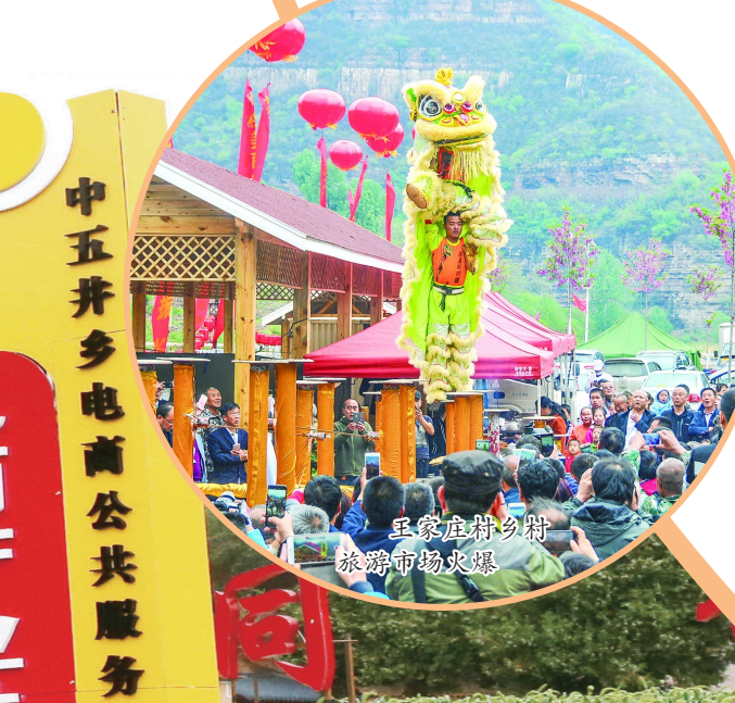
平顺县中五井乡电商基地。