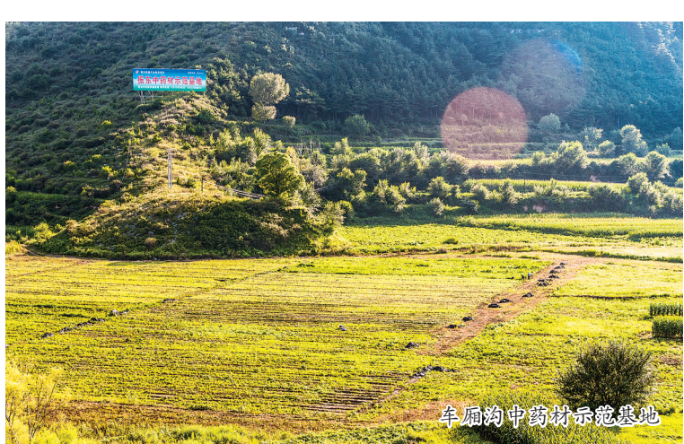
平顺县中五井乡电商基地。