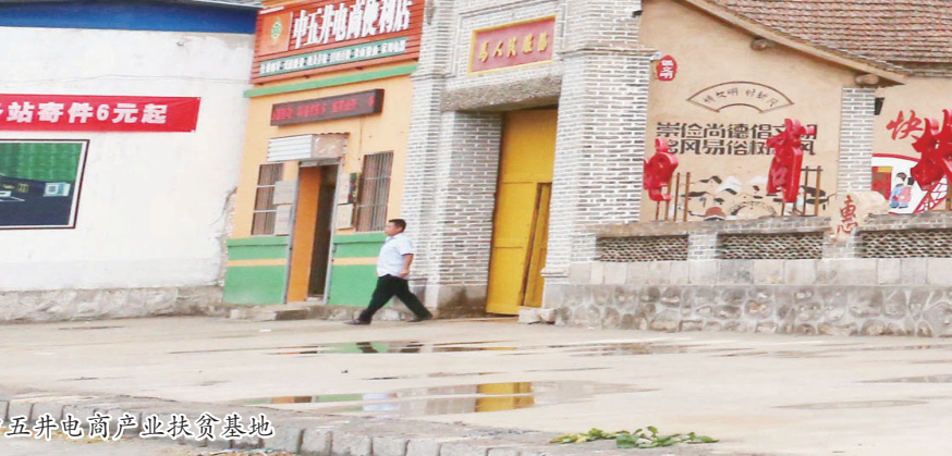
电商产业扶贫基地。

抓队伍建设，提升战斗力。建立“一部四区”组织体系，“一部”即脱贫攻坚总指挥部，下设9个专项指挥部，“四区”即把全县按照地缘关系，划分为四个战区，分别由县四大班子主要负责人担任战区总指挥，形成了分区作战、协调推动、综合推进的齐抓共管格局。 夯实基层组织建设，选派244名优秀干部担任村第一书记，9名年轻干部到村担任党组织书记，配齐配强了贫困村党组织书记和“两委”班子。2016年以来，全县共从脱贫一线择优提拔干部338名，占提拔重用总数的92%。 开展党员“结对帮扶”活动，组织全部党员至少结对帮扶1户贫困户，坚持扶智与扶志相结合，开办“农民夜校”、文明实践学习所等，党员带头讲党课、宣讲党的扶贫政策，开展感恩教育，党员带头脱贫致富，带动群众在脱贫攻坚中争当“脱贫模范”，帮助困难群众树立脱贫志气、增强主动脱贫意识，在全县凝聚起了党群合力、勠力同心的强大脱贫力量。 抓基层基础，提升保障力。按照乡镇60万元、村级组织10万元运转经费和社区12万元的标准划拨，加大基层党建经费投入，每村每年党建工作经费不少于1万元，确保工作正常开展。通过盘活集体资产、发展生态农业、村企合作共建、依托资源、活用电商平台、抱团发展产业等方式，持续壮大村级集体经济，增强农村持续发展能力。采取“岗位报酬+生活补贴+定额补助+年终奖金”的模式，结构化薪酬管理现任村“两委”主干。持续开展争创“红旗党支部”，荣获“红旗党支部”称号的年收入在4万元左右，有效激发村“两委”主干创先争优、干事创业的积极性。