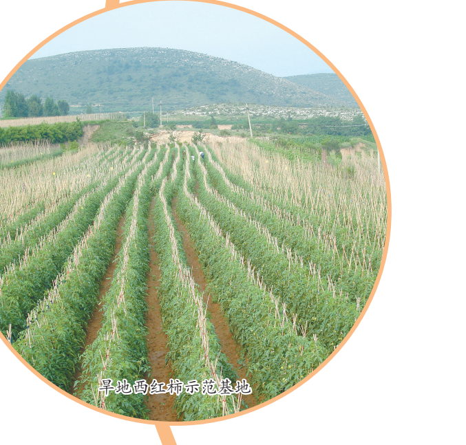
平顺县中五井乡电商基地。