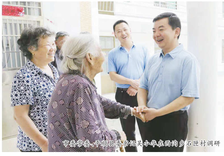
平顺县委书记带领干部慰问贫困户，握手致意，气氛温馨。