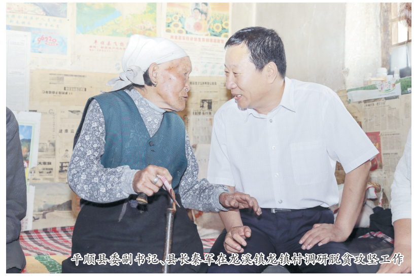
平顺县委书记在田间地头调研脱贫攻坚工作。