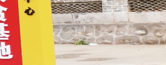
平顺县中五井乡电商基地。

聚力脱贫攻坚，坚持靶向施策，平顺县将专项扶贫、行业扶贫、社会扶贫有机结合，将各项扶贫政策的落实转化成群众的获得感。 健康扶贫“应保尽保”。以“健康平顺”建设为统领，制定出台了《平顺县健康扶贫工作实施方案》《关于开展健康扶贫“双签约”活动的通知》等10多个文件，按照“村不漏户，户不漏人，人不漏项”的原则，为所有贫困人口建立了电子健康档案，认真开展“双签约”服务，共签约8516户。先后投入1224万元，建成标准化卫生室279个，按要配齐配全了32种基本设备和16类186种常用药品。县域内医疗机构设立“一站式”结算平台，全面落实建档立卡贫困人口“先诊疗后付费”政策，全县建档立卡贫困户参保率达到100%。全面实施“三保险、三救助”政策，大力推进重大传染病、地方病、慢性病防治，持续开展建档立卡农村妇女“两癌”免费检测、“二癌三健”、减盐减油控高血压行动等工作，全方位提升居民健康水平，因病致贫、因病返贫现象不断减少。截至8月底，全县建档立卡贫困人口已住院医疗救助18438人次，总费用5423.17万元，报销4417.01万元，占总费用的81.44%；慢性病补偿28281人次，特殊慢性病补偿3323人次，报销1610.41万元，最大程度降低了贫困人口的治疗支出。