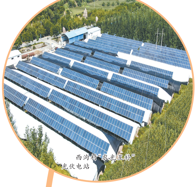
西沟乡“农光互补”光伏电站。