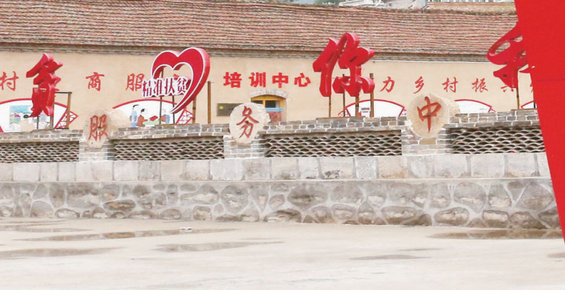
中五井乡电商公共服务中心。

特色社会主义思想为指导，深入贯彻落实党的十九大精神、习近平总书记关于扶贫开发的重要论述和视察山西重要讲话精神，紧紧围绕中央、省、市总体部署，按照建设“一地两区”、打造“三宜”美丽平顺的工作方略，坚持以脱贫攻坚统领经济社会发展全局，弘扬纪兰精神，坚持精准脱贫，上下一心、尽锐出战，全县脱贫攻坚取得阶段性成果。截至2018年底，全县共退出贫困村205个、脱贫44107人，贫困发生率下降到5.8%，脱贫村集体经济全部“清零”，基础设施和公共服务更加完善，农村居民人均可支配收入提高到6848元，贫困户“两不愁”基本解决，“三保障”水平显著提升。