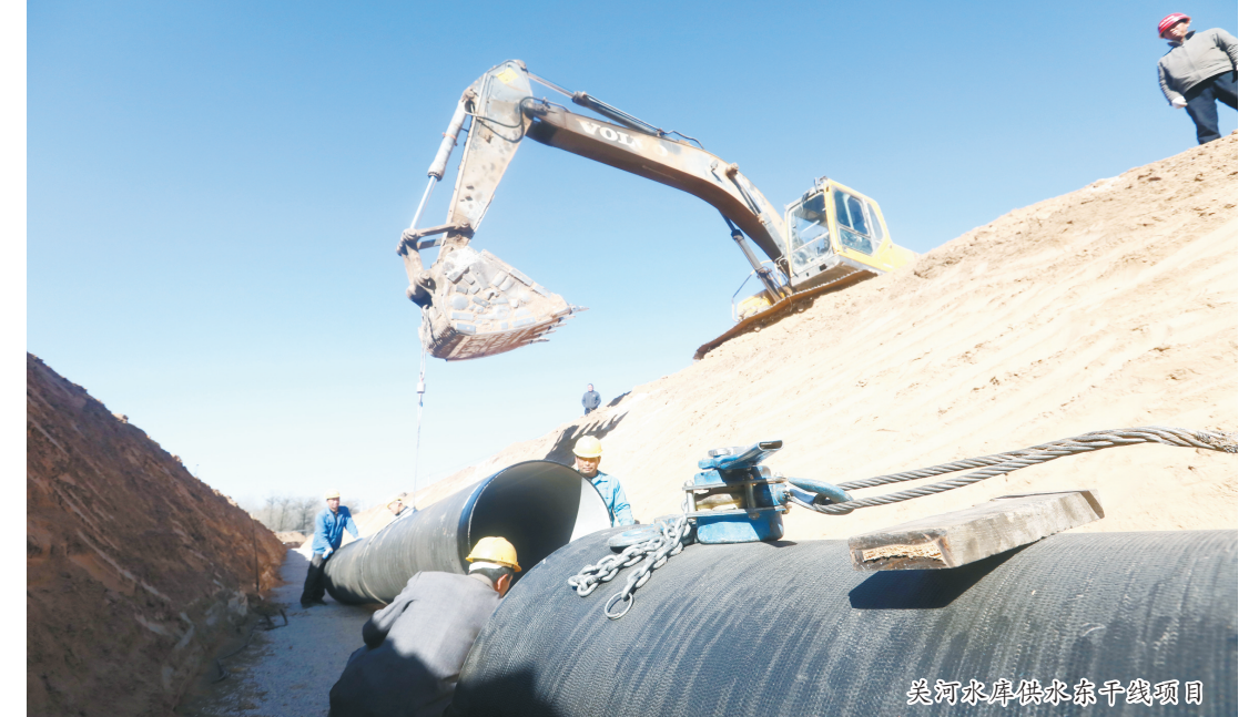
沁源县泉泉泉干渠项目