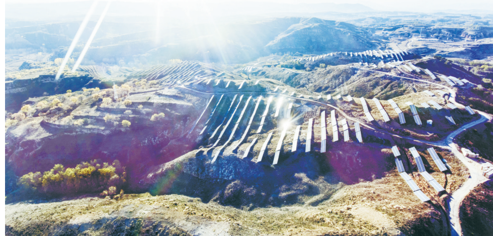
蒲泉乡象上村500MW纯农电项目