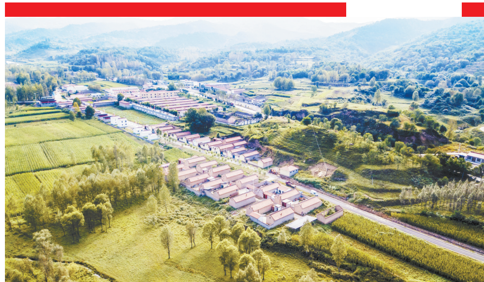
分水岭富儿头移民新村