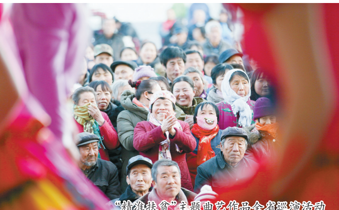
情韵隰山 在隰山艺术作品全省巡展活动

2019年经济社会发展主要目标是:全县地区生产总值增长6.5%左右,规模以上工业增加值增长7%,全社会固定资产投资增长7%,社会消费品零售总额增长7.5%,一般公共预算收入增长7%,城镇居民人均可支配收入增长6.5%,农村居民人均可支配收入增长8%。约束性指标严格按照省市下达的目标任务确保完成。