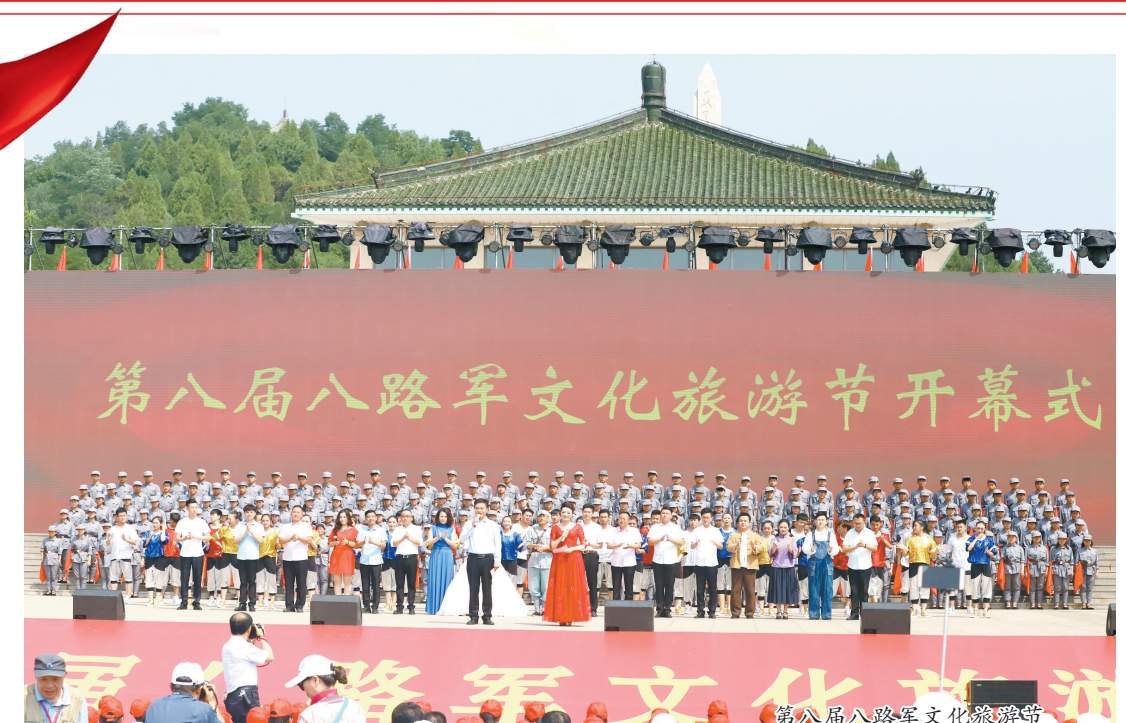
第八届八路军文化旅游节开幕式