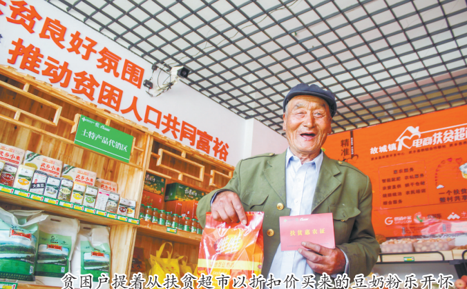
贫困户脱贫从扶资金中领到分红金