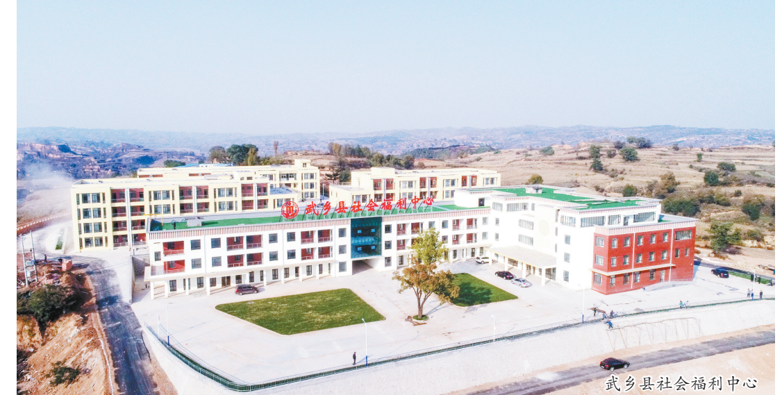
武乡县社会福利中心