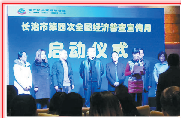
全市第四次全国经济普查宣传月启动仪式举行,掀起全市经济普查宣传热潮。