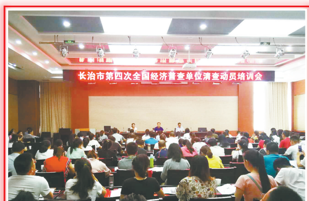
7000余名普查人员参加全市第四次全国经济普查单位清查动员培训会。