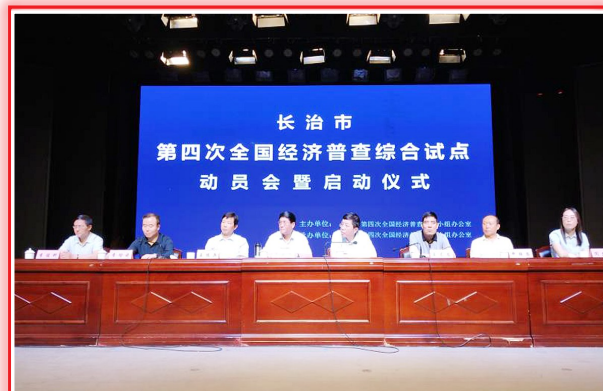
全市第四次全国经济普查综合试点动员会暨启动仪式举行,标志着我市经济普查进入实战阶段。

我市第四次全国经济普查在市委、市政府高度重视和支持下,全市30余个单位部门的通力合作圆满完成了试点、前期宣传、培训、普查区的划分和绘图、选聘普查指导员和普查员、编制清查底册、入户清查等工作。当前,即将进入正式普查阶段。