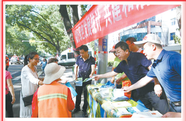
进入“宣传月”,全市第四次全国经济普查工作人员走上街头向群众宣传经济普查知识。