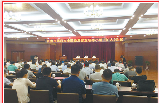
全市第四次全国经济普查领导小组(扩大)会议召开,全面动员部署我市经济普查工作。